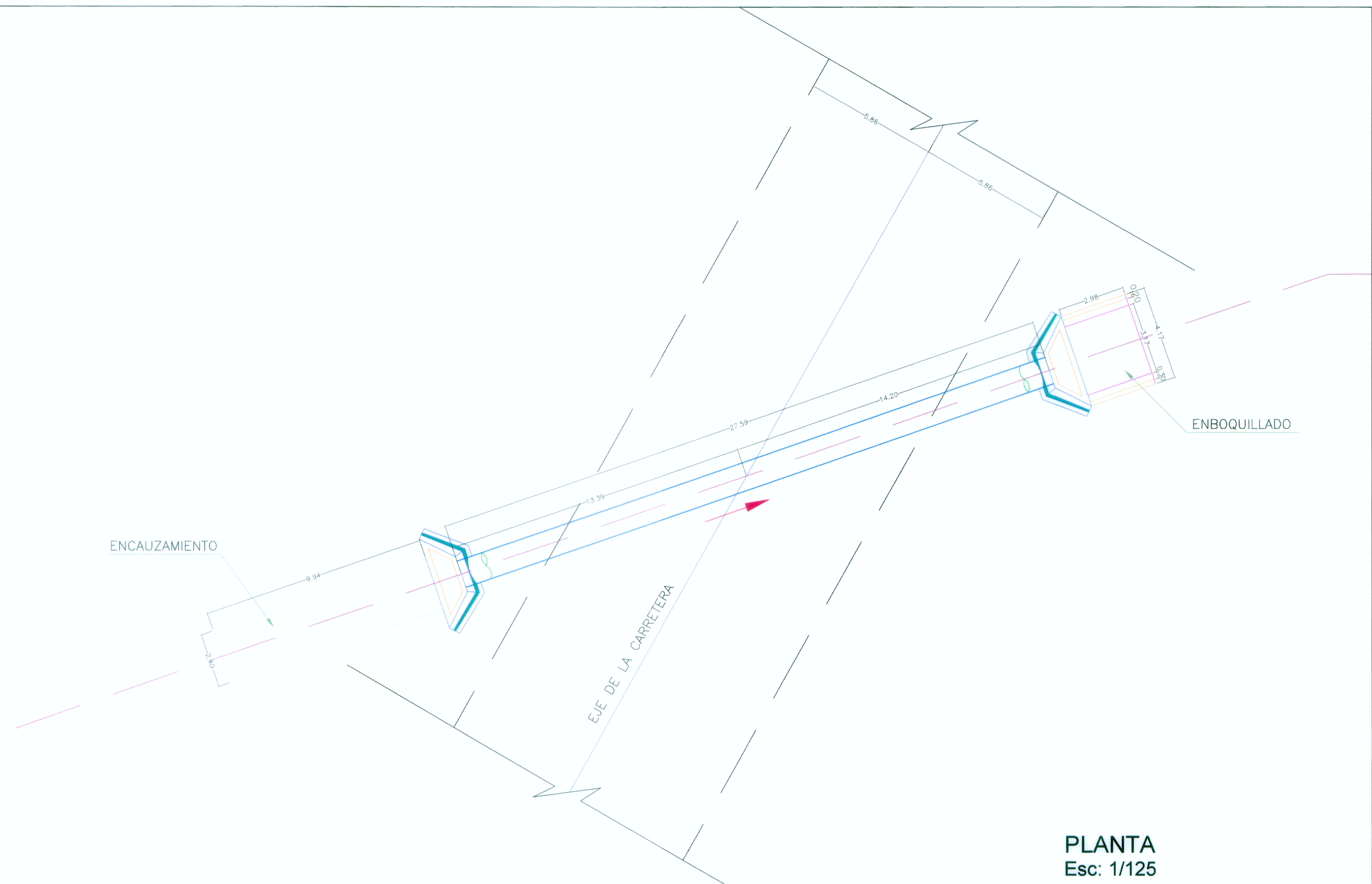
PLANTA Esc: 1/125