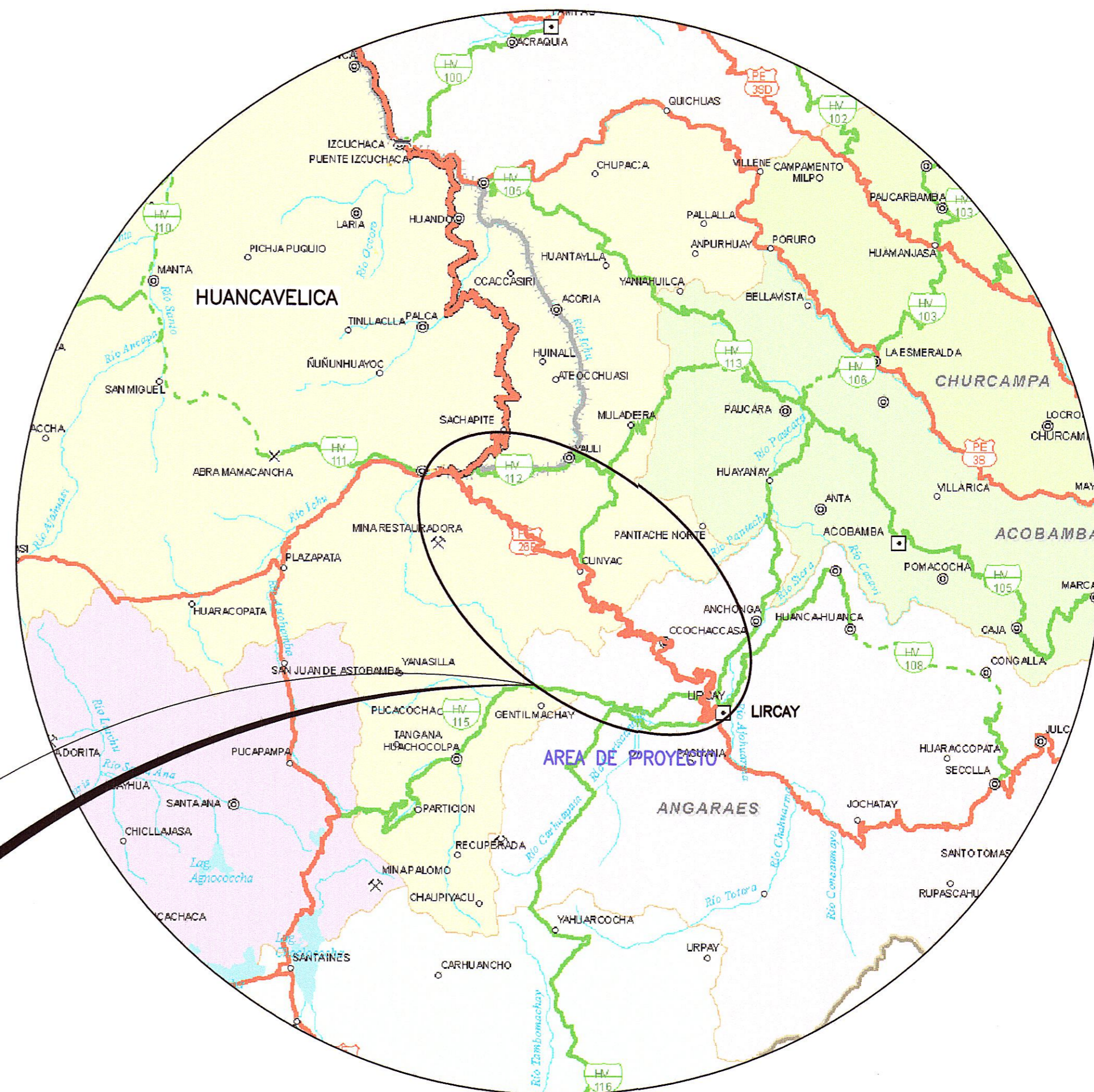
UBICACION A NIVEL REGIONAL