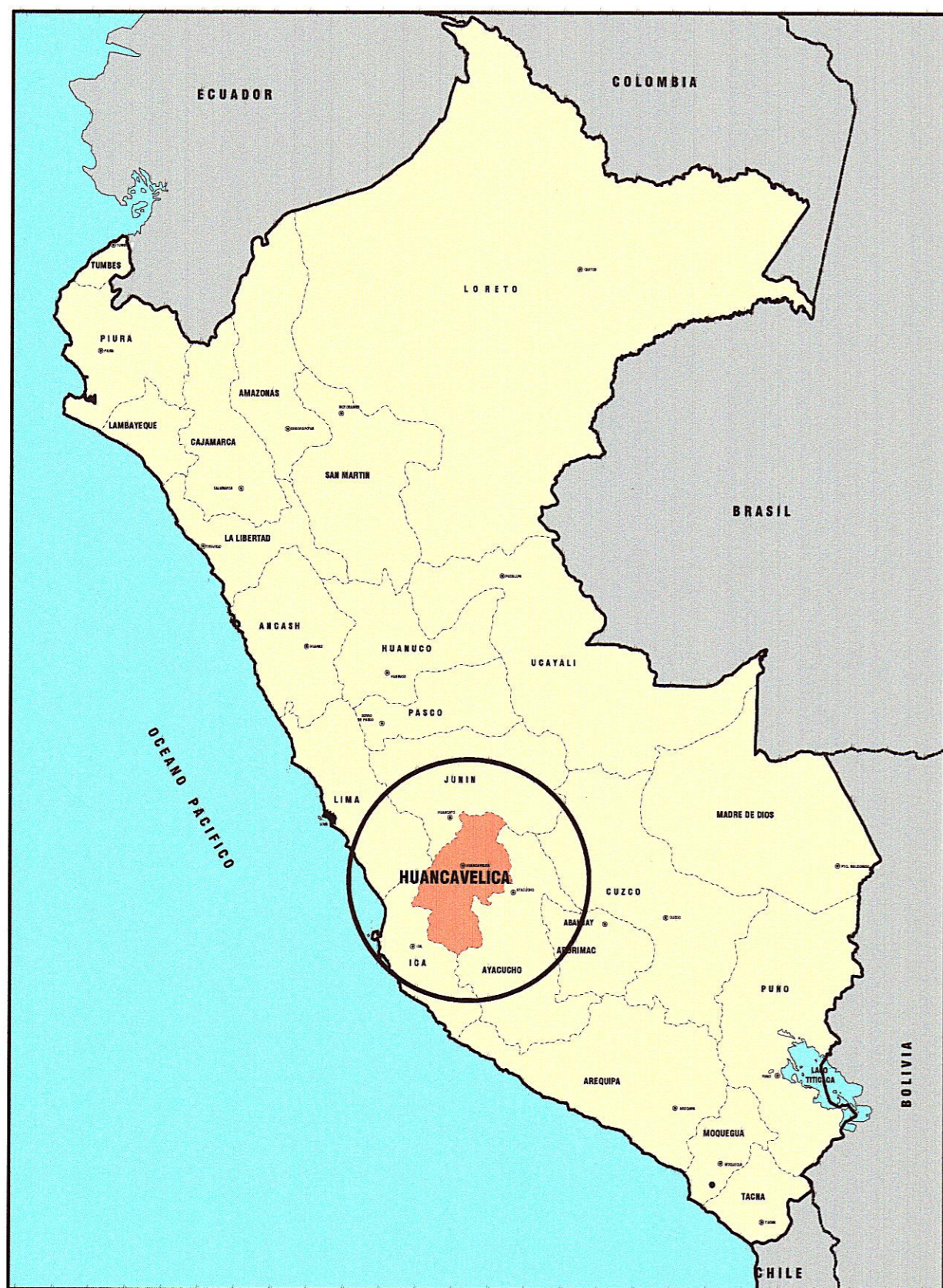
UBICACION A NIVEL NACIONAL