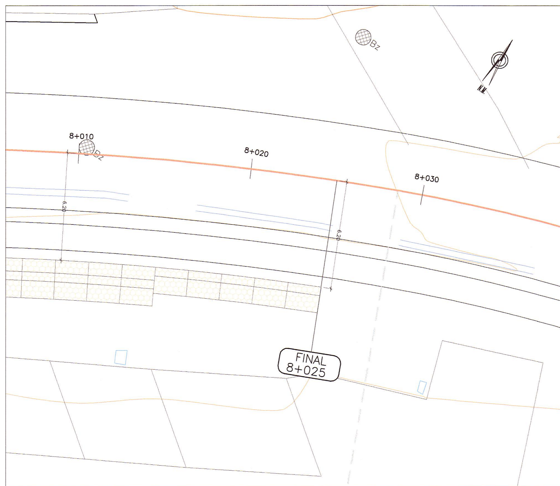
PLANTA ESC. : 1/125