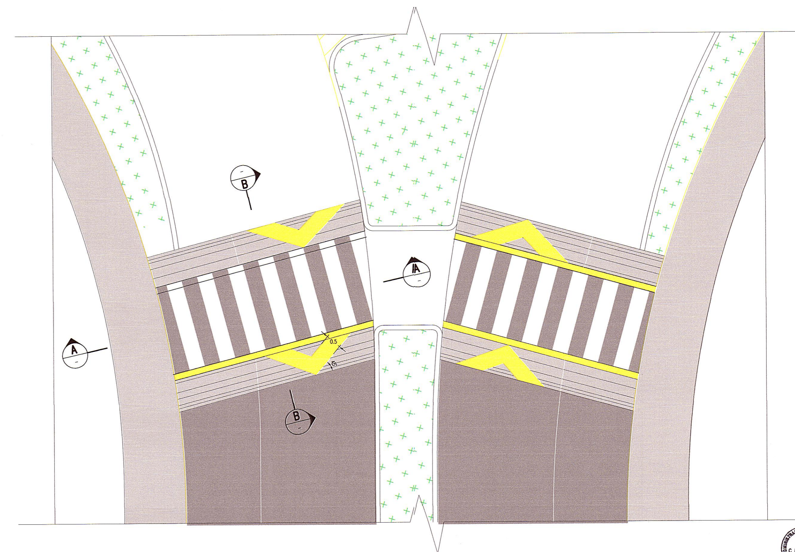
REDUCTOR DE VELOCIDAD ESC 1:75

Nota: Medidas del resalto de acuerdo a la Directiva N° 01-2011-MTC/14 Reductores de Velocidad Tipo Resalto para el Sistema Nacional de Carreteras (SINAC)