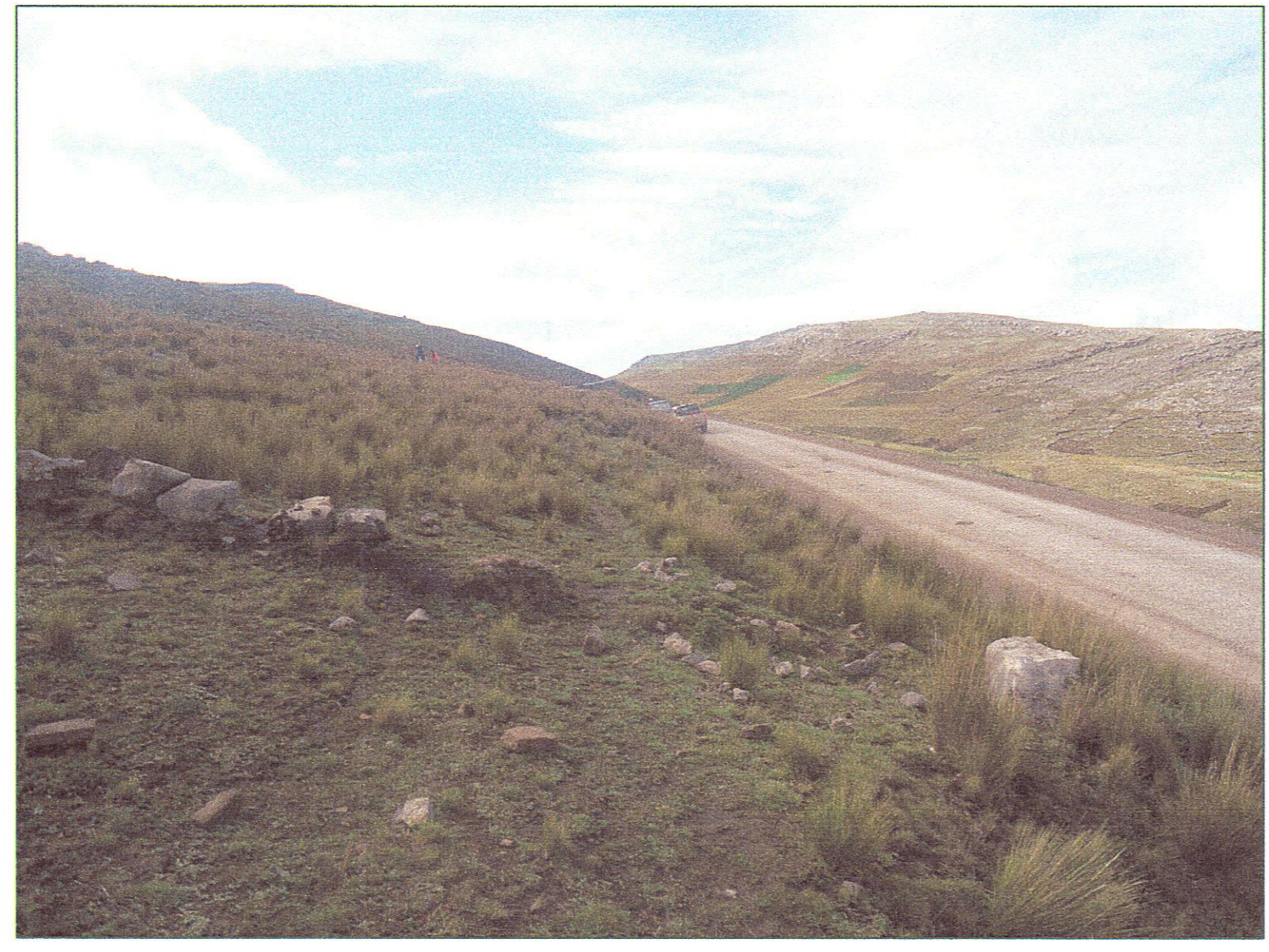
ESTACION GEOMECANICA N° 5 KM 8+705