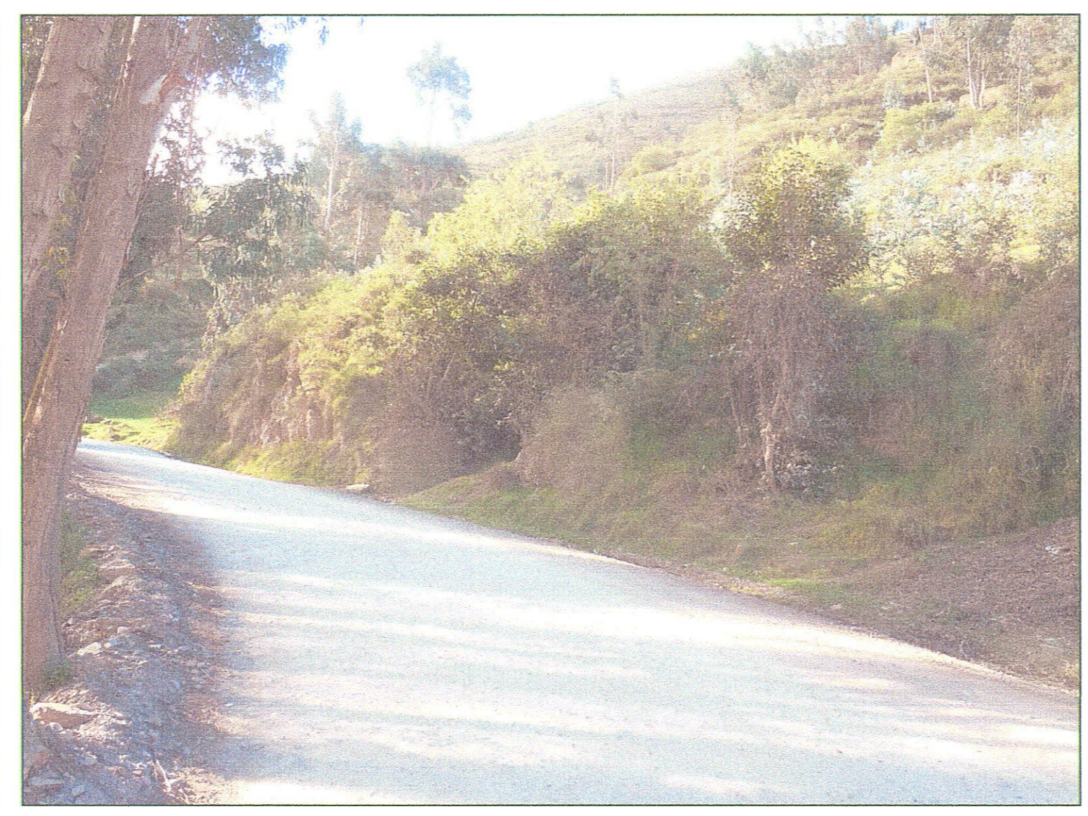
ESTACION GEOMECANICA N° 31 KM 35+698