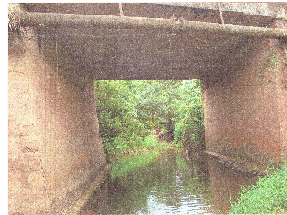
07 Vista del ponto desde aguas arriba