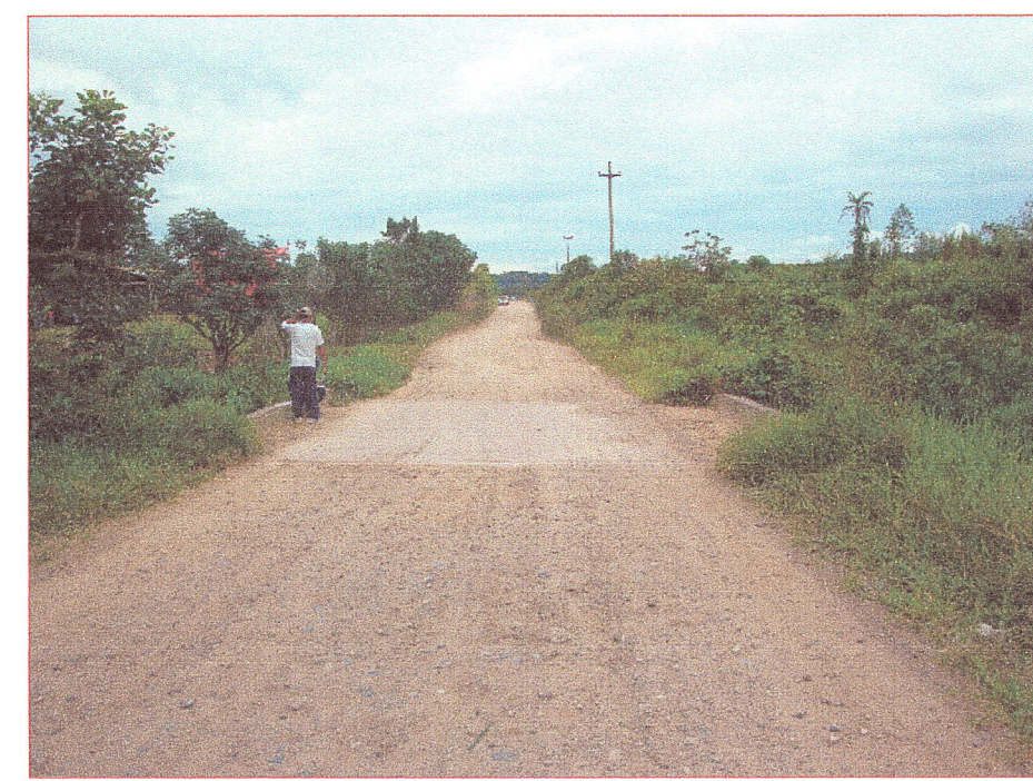
01 Vista de la superficie de rodadura