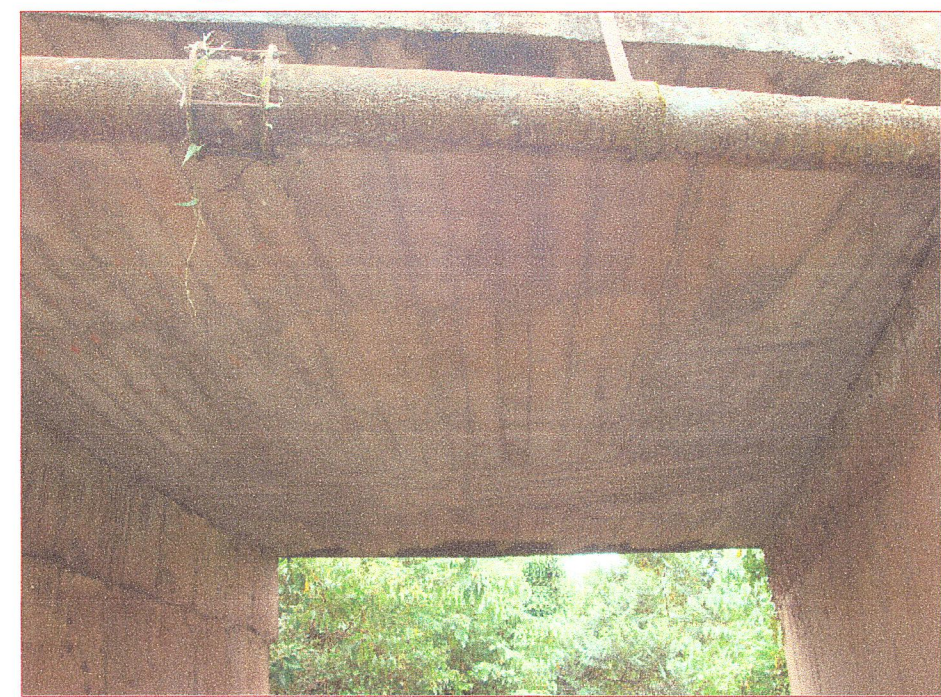
05 Vista de la losa de concreto armado