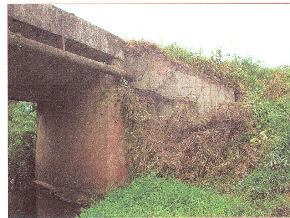
04 Vista de la pantalla del estribo y aleros