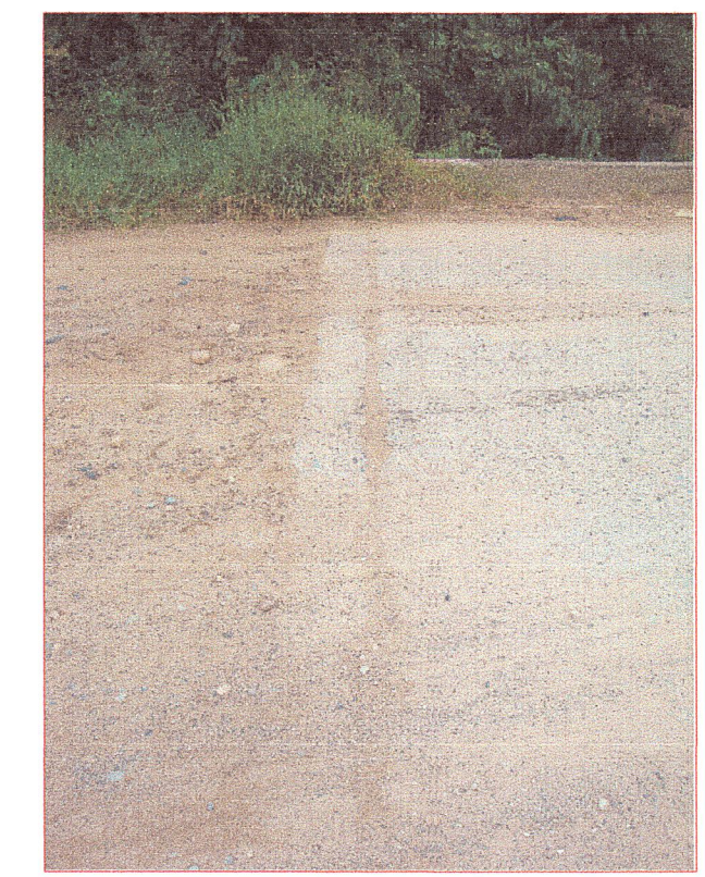
02 Vista de la junta de dilatacion