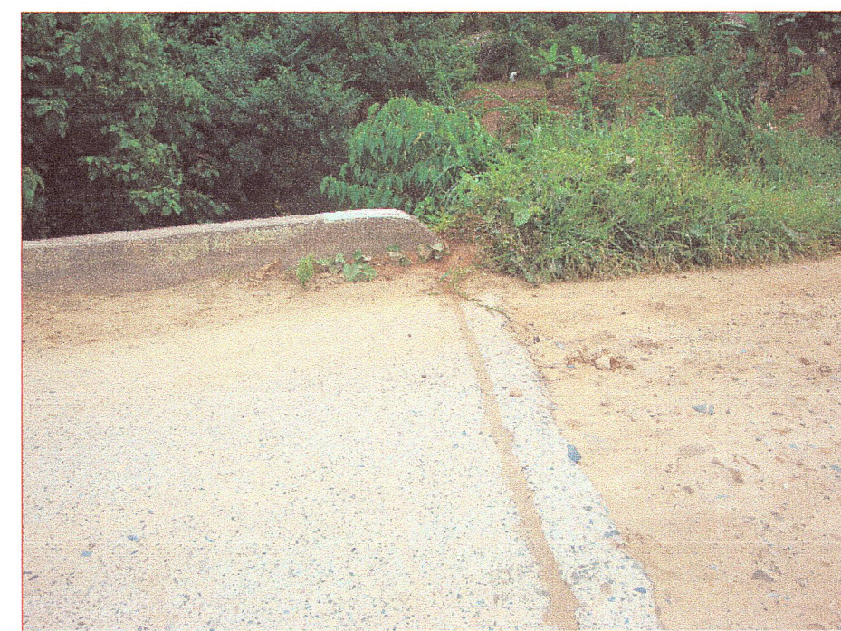
03 Vista de la junta de dilatacion