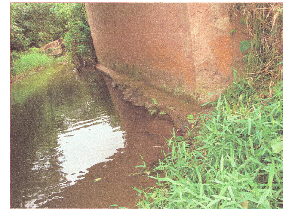
08 Vista de socavacion de zapata en estribos