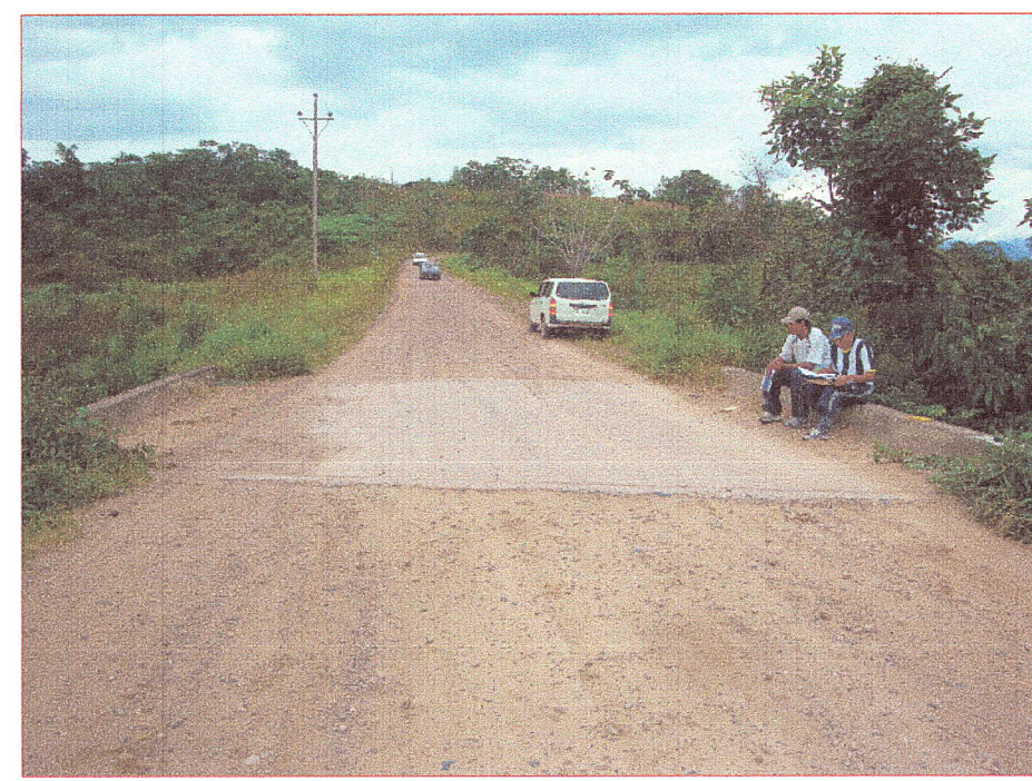
01 Vista de la superficie de rodadura