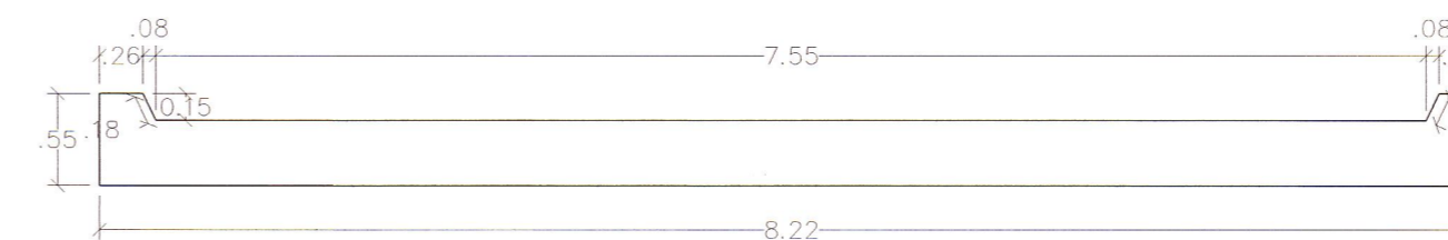
SECCION TRANSVERSAL ESCALA 1/50