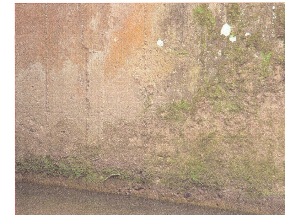
05 Vista de la pantalla estribo