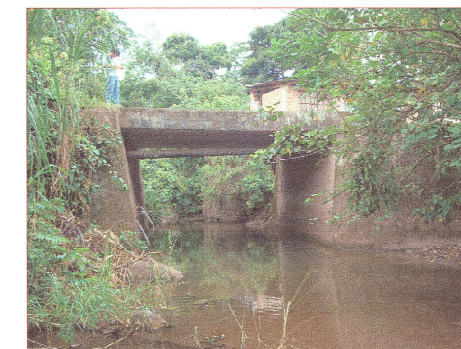
07 Vista del ponton desde aguas abajo