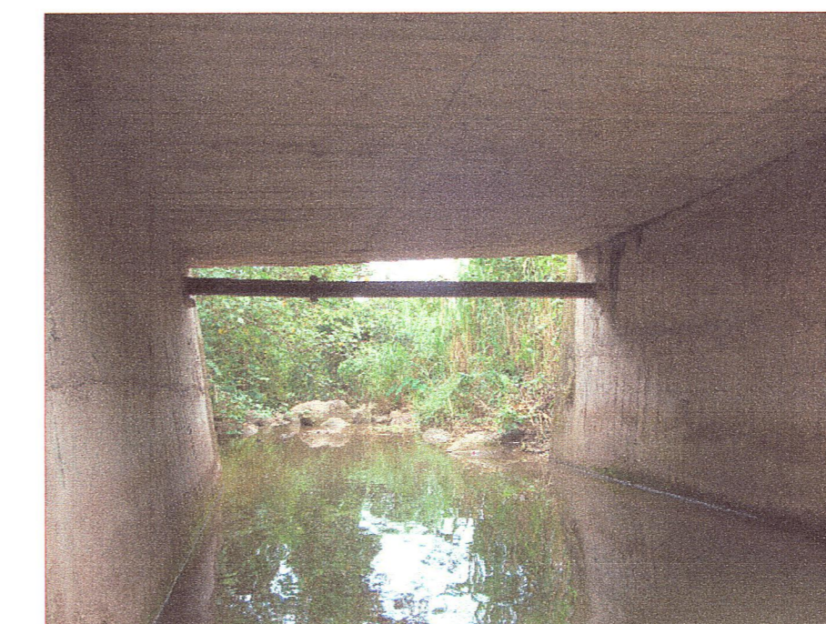
08 Vista del ponton desde aguas arriba