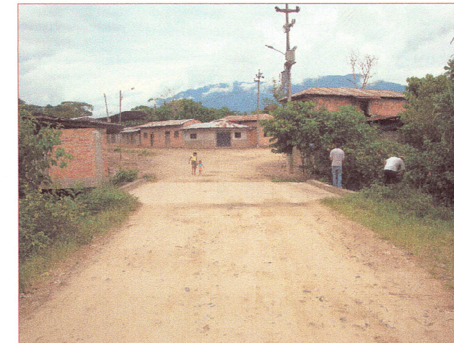
01 Vista de la superficie de rodadura