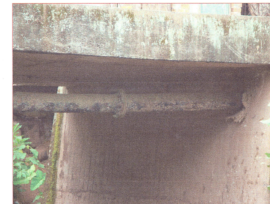
04 Vista de la losa de concreto armado