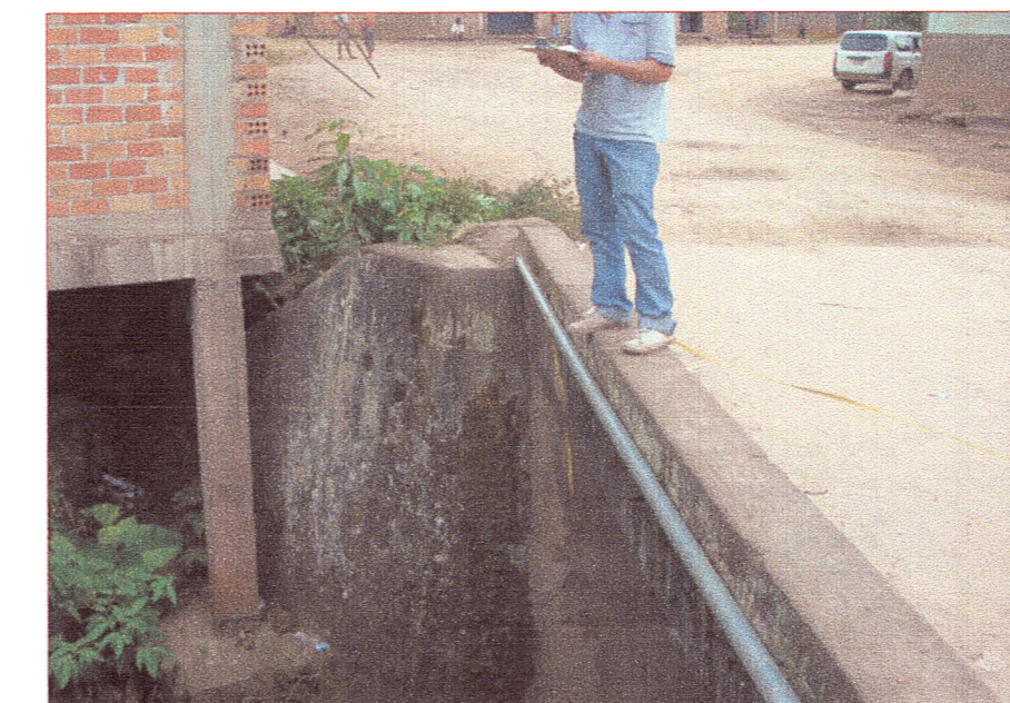
02 Vista del parapeto de losa de concreto