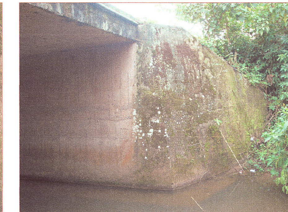
06 Vista del alero del estribo