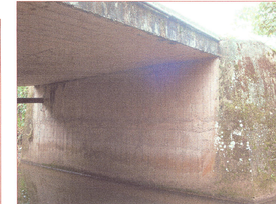
03 Vista de unión losa de concreto armado y estribo