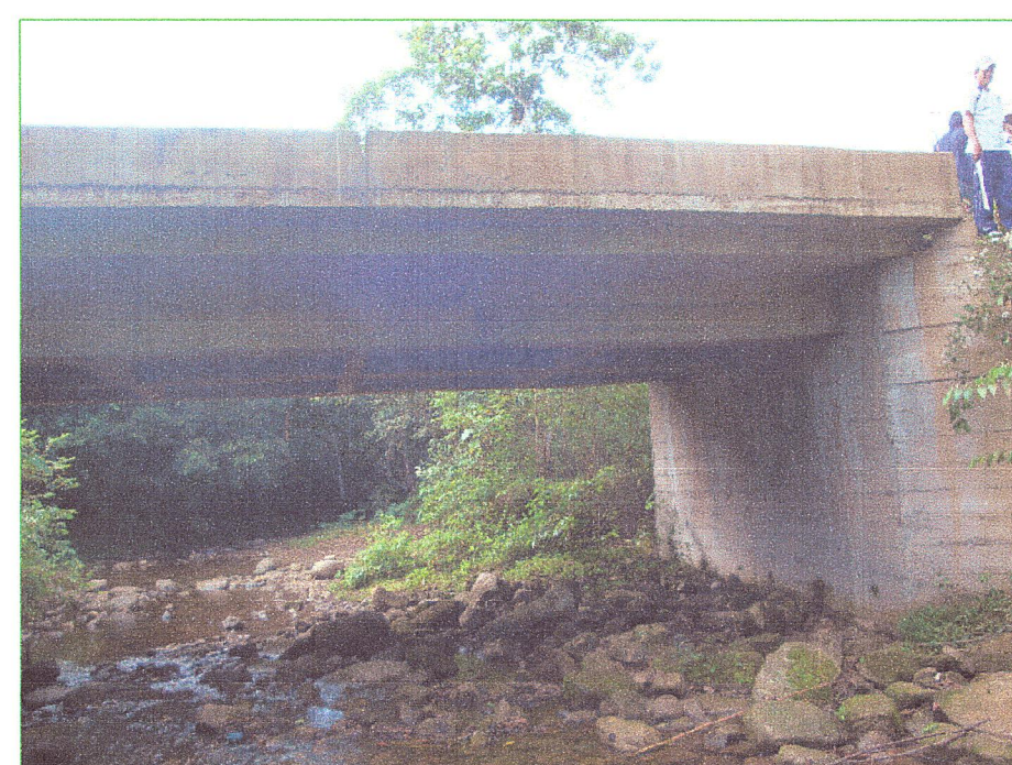
02 Vista lateral del puente