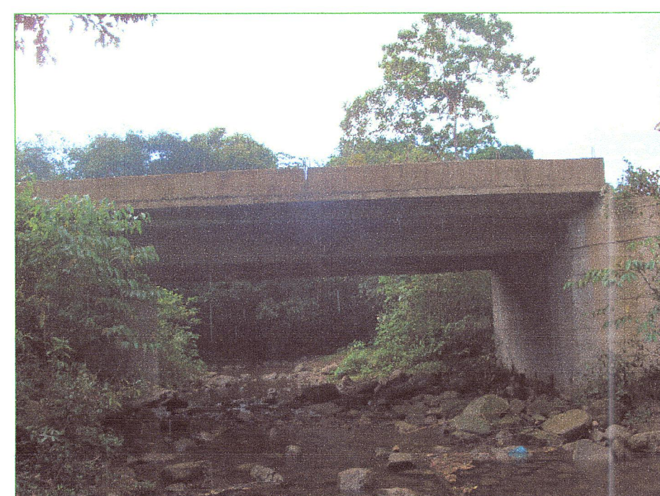
01 Vista desde aguas arriba del puente