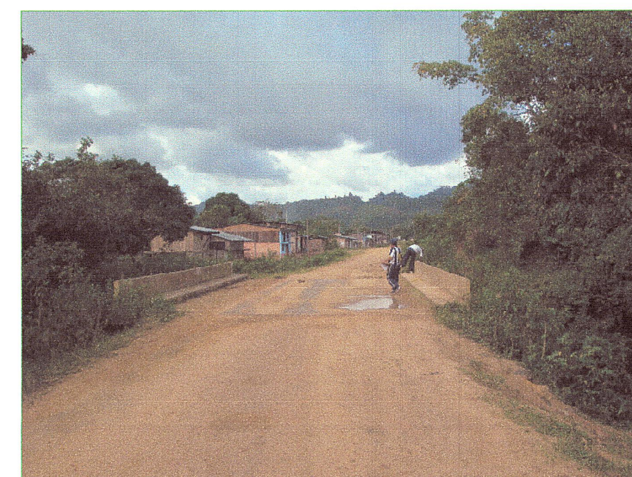
03 Vista de la superficie de rodadura