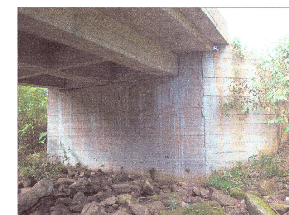
08 Vista de estribo del puente