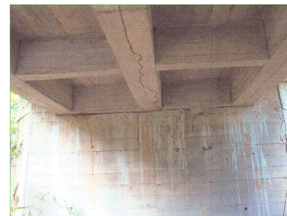
07 Vista de vigas inferiores del puente