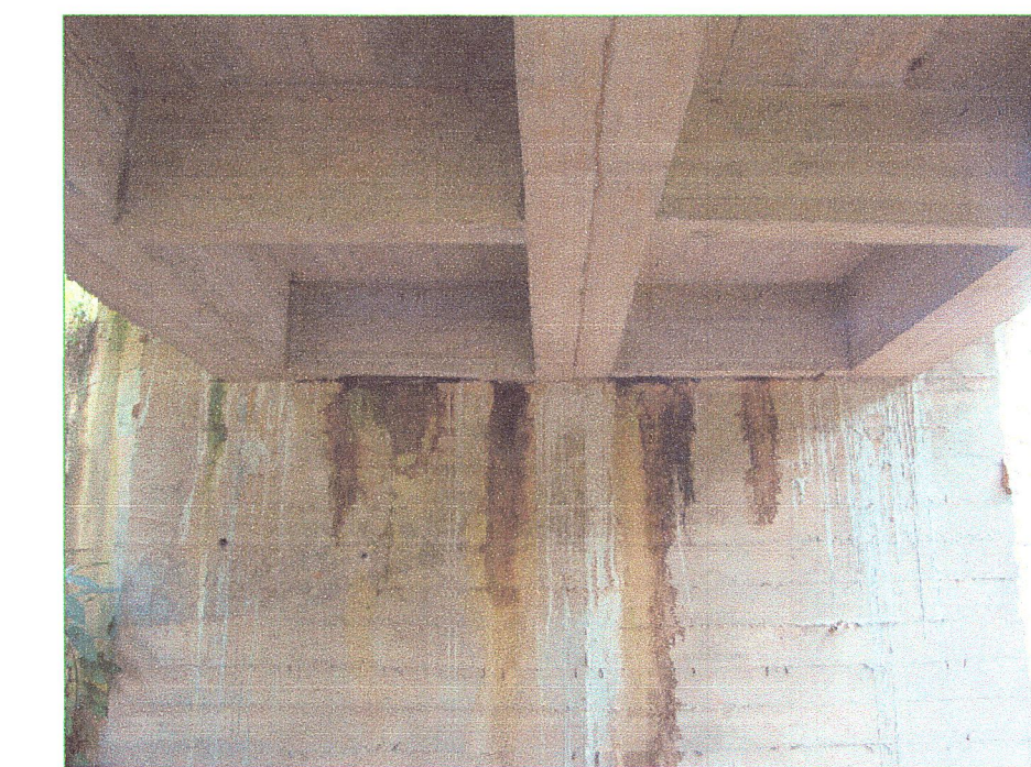
09 Vista de esribos del puente