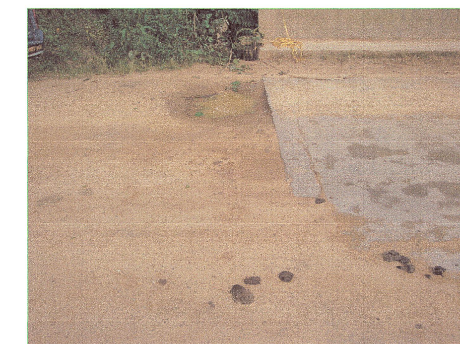
04 Se observa que no tiene losa de aproximacion