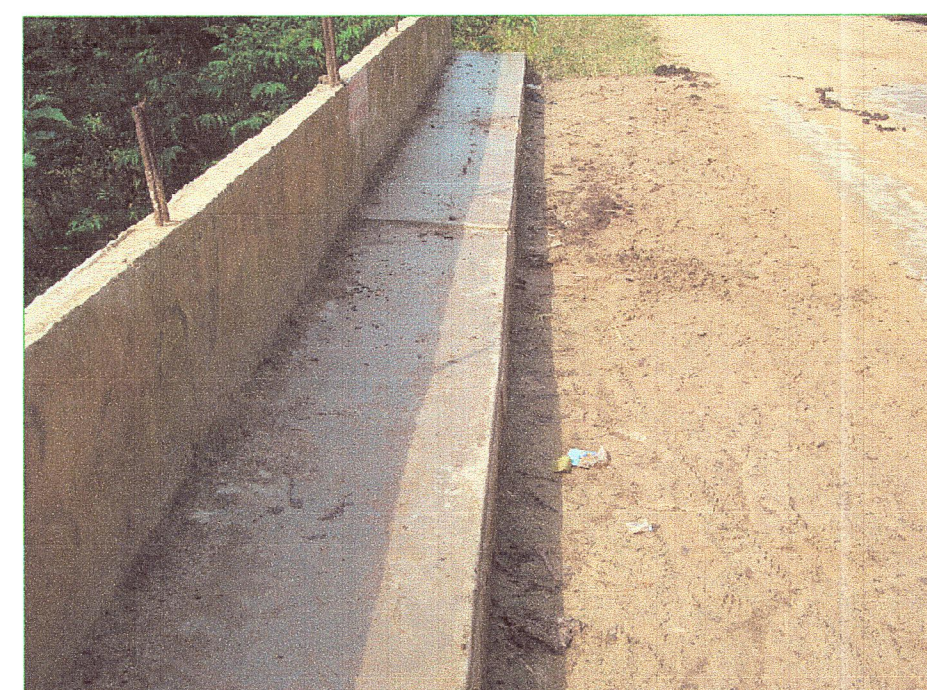
05 Vista lateral de vereda y parapeto