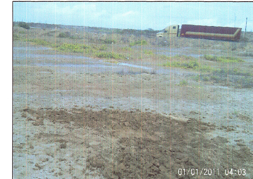
CANTERA CARDALITO (RELLENO)