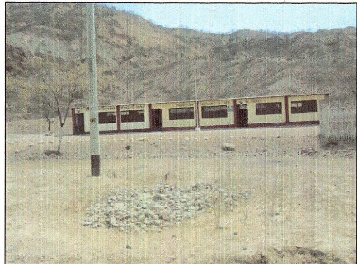
CAMPAMENTO Y PATIO DE MÁQUINAS (km 1220+500) Y DEPÓSITO DE MATERIAL EXCEDENTE (km 1220+500)