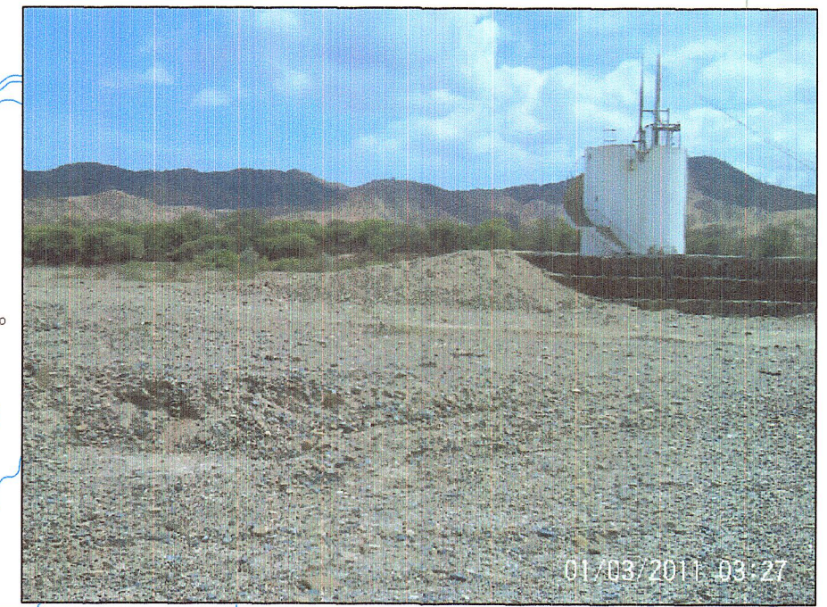
CANTERA QDA. FERNANDEZ (SECTOR LA BOMBA) CONCRETO, ASFALTO, BASE, SUBBASE