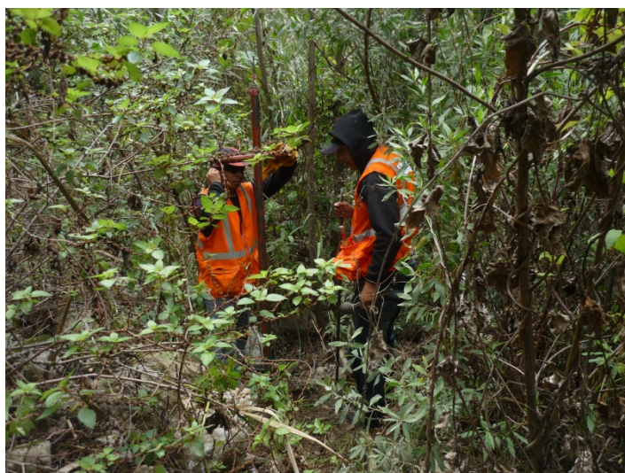
Foto 09.- Vista en instantes previos a uno de los disparos en la Línea L-10.