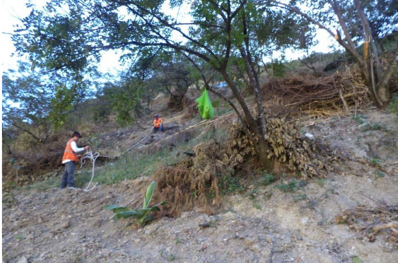
Foto 01.- Vista General de la Línea Sísmica L-13.