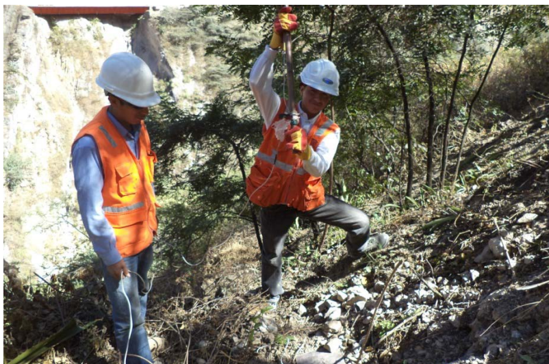
Foto 03.- Vista de la Generación de uno de los Shots en una de las Líneas Sísmicas.