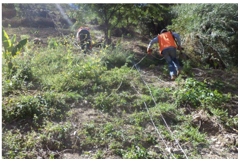
Foto 06.- Vista General de la Instalación de Geófonos en una de las Líneas Sísmicas.