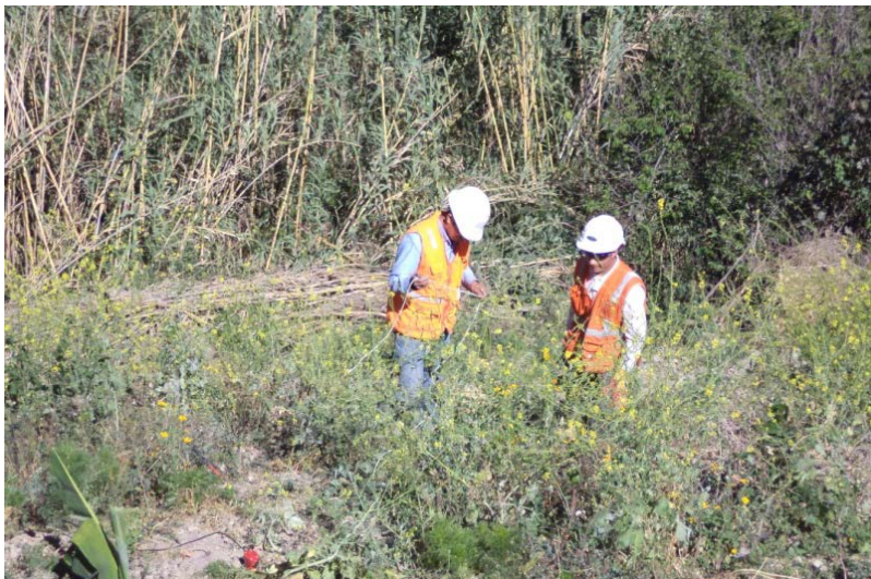
Foto 05.- Vista General de la Instalación de Geófonos en una de las Líneas Sísmicas.