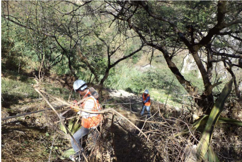
Foto 04.- Vista General de una de las Líneas Sísmicas.