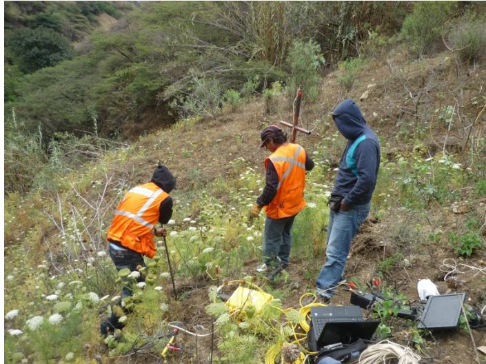
Foto 07.- Vista General de la Línea Sísmica L-03