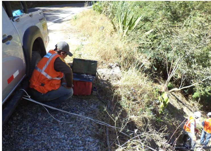
Foto 02.- Vista General de la toma de datos.