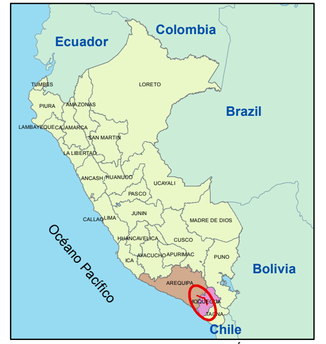
PLANO DE LOCALIZACIÓN Esc: 1:25,000,000