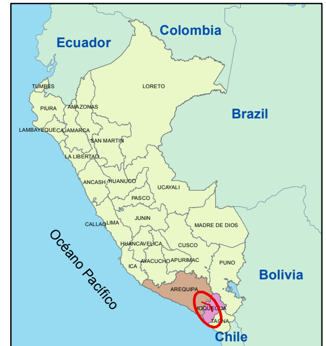
PLANO DE LOCALIZACIÓN Esc: 1:25,000,000