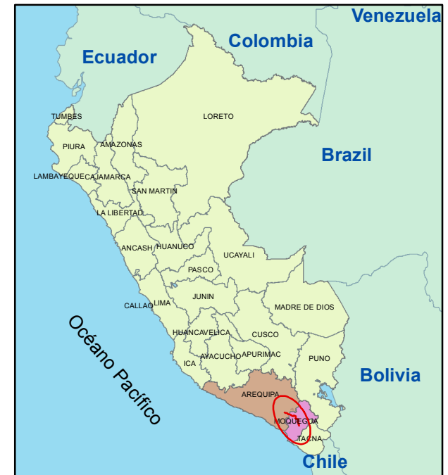
PLANO DE LOCALIZACIÓN Esc: 1:25,000,000