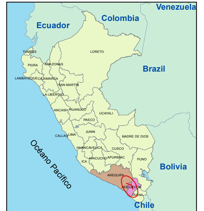
PLANO DE LOCALIZACIÓN Esc: 1:25,000,000